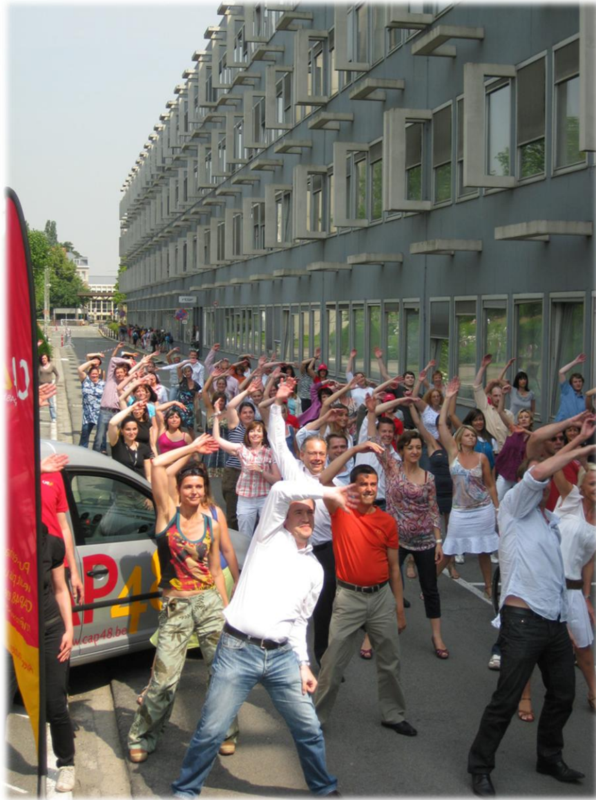
Répétition générale de la flashmob devant les bureaux de CAP 48 à Reyers